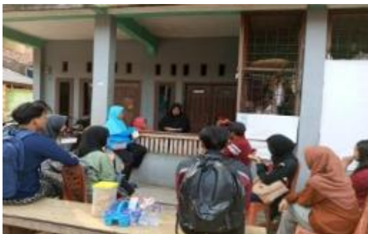
Gambar 1. Sosialisasi dengan warga tentang Bank Sampah

Dampak dari pendampingan ini terlihat dari meningkatnya jumlah warga yang secara sukarela ikut serta dan konsisten menyetorkan sampah terpilah. Tidak hanya warga di sekitar Jalan Kramat Jaya, beberapa desa dan perumahan di wilayah Hajimena mulai berpartisipasi aktif. Melalui edukasi yang disampaikan saat penimbangan, bazar BUMDes, serta kunjungan langsung ke lingkungan warga, masyarakat mulai menyadari bahwa pengelolaan sampah bukan hanya tanggung jawab individu, tetapi merupakan upaya kolektif untuk menjaga lingkungan bersama. Peningkatan partisipasi ini berdampak langsung pada sampah terpilah yang berhasil dikumpulkan. Jika sebelumnya hanya sekitar 20 kg, setelah beberapa kali pendampingan dan pengambilan sampah di beberapa titik desa, sampah terpilah meningkat signifikan hingga mencapai sekitar 300 kg dalam satu periode pengangkutan.