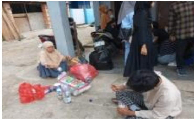
Gambar 2. Partisipasi Warga dalam memilah Sampah

Tingkat keaktifan masyarakat dalam kegiatan Bank Sampah Caraka juga didukung oleh keterlibatan langsung peserta pelatihan dan pendampingan. Kegiatan pengabdian kepada masyarakat ini melibatkan 8 orang mahasiswa pengabdian yang berperan aktif dalam proses sosialisasi, edukasi pemilahan sampah, pendampingan penimbangan, serta dokumentasi kegiatan. Kehadiran mahasiswa membantu menjembatani komunikasi antara pengelola bank sampah dan masyarakat, sehingga proses penyampaian informasi dapat diterima dengan lebih mudah oleh warga.