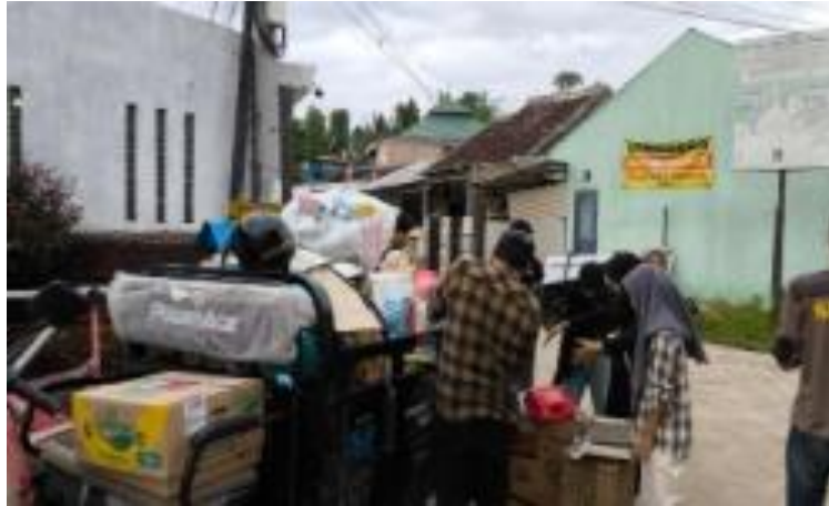
Gambar 3. Pengambilan Sampah ke Rumah Warga

Menariknya, Bank Sampah Caraka juga menerima prabotan rumah tangga bekas yang masih dapat dimanfaatkan atau didaur ulang, seperti peralatan plastik, ember, dan perlengkapan rumah tangga lainnya. Selain itu, sebagai bentuk inovasi dalam pengelolaan sampah, Bank Sampah Caraka juga menerima minyak jelantah dari rumah tangga warga yang dapat ditukarkan dengan minyak baru. Program ini memberikan manfaat langsung bagi masyarakat sekaligus mencegah pencemaran lingkungan akibat pembuangan minyak bekas sembarangan.